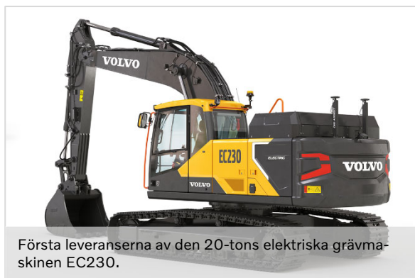
Första leveranserna av den 20-tons elektriska grävmaskinen EC230.