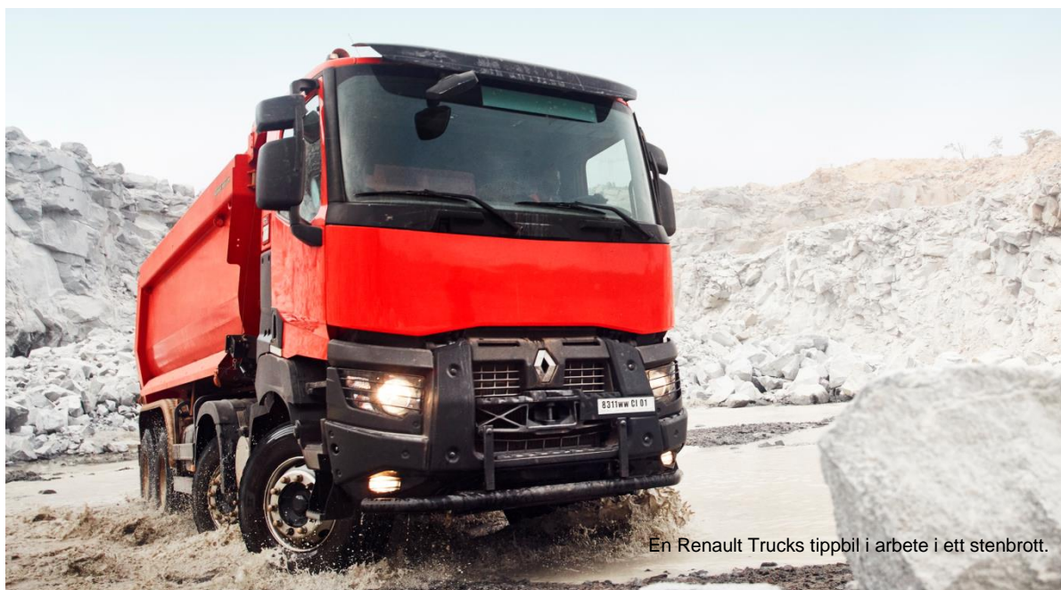
En Renault Trucks tippbil i arbete i ett stenbrott.