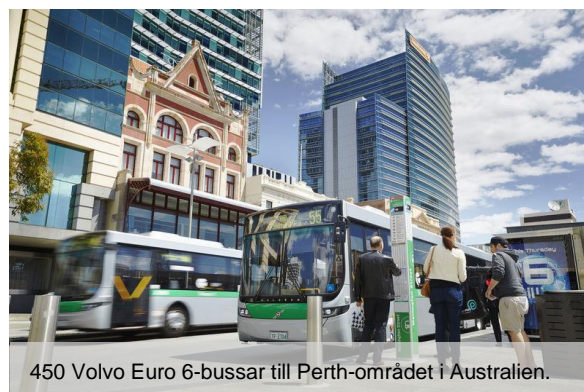
450 Volvo Euro 6-bussar till Perth-området i Australien.

Under Q1 2019 ökade nettoomsättningen med 20% till 6.847 Mkr (5.687) jämfört med samma period år 2018. Juste-