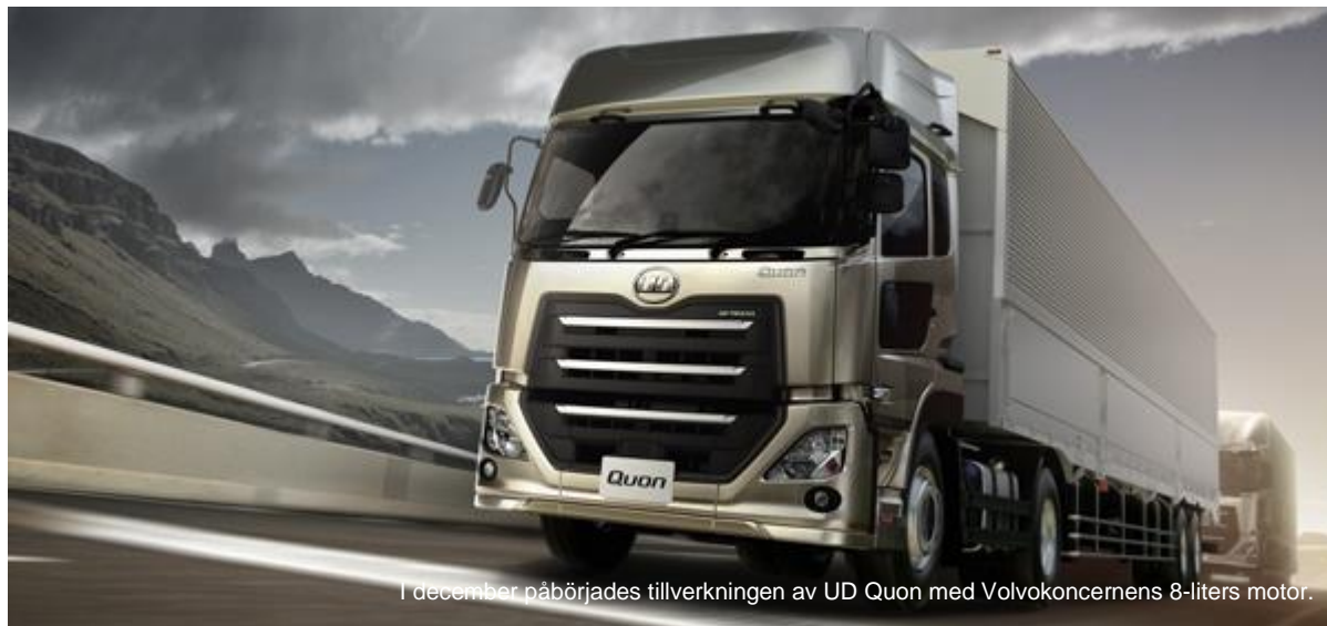
I december påbörjades tillverkningen av UD Quon med Volvokoncernens 8-liters motor.