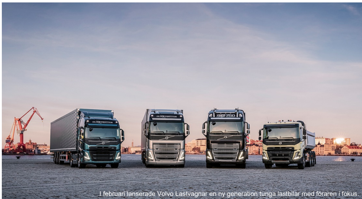
I februari lanserade Volvo Lastvagnar en ny generation tunga lastbilar med föraren i fokus.