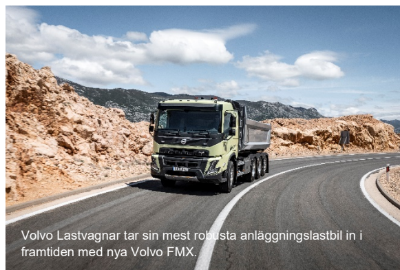
Volvo Lastvagnar tar sin mest robusta anläggningslastbil in i framtiden med nya Volvo FMX.

Utbrottet av COVID-19 hade en begränsad påverkan på