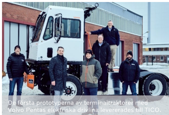
De första prototyperna av terminaltraktorer med Volvo Pentas elektriska drivlina levererades till TICO.

Efterfrågan på marknaden för fritidsbåtar var fortsatt stark under Q4. Marknaden för kommersiella fartyg har återhämtat sig och investeringar i nya fartyg, som sköts upp på grund av covid-19, har återstartats med ett ökat intresse för mer hållbara lösningar.